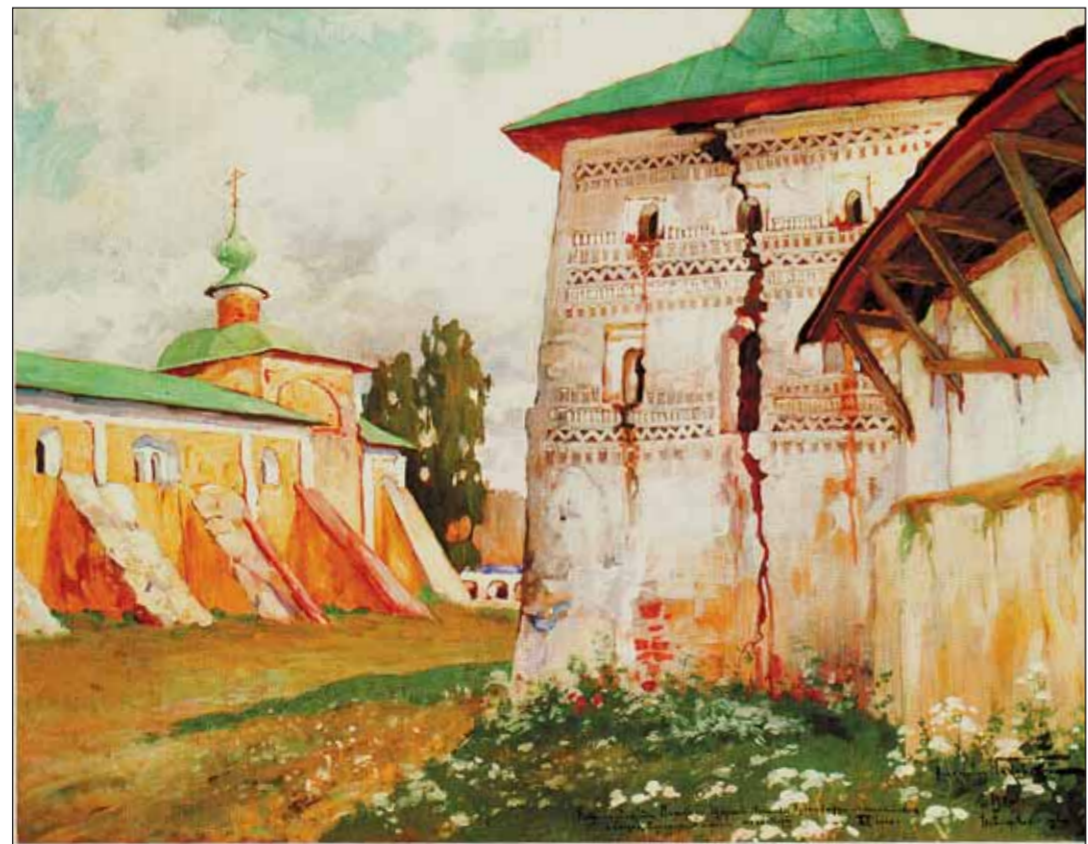
А.В. Маковский. Монастырские стены. 1911 г.