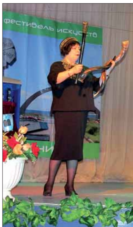
одна семья, прекрасная, разноцветная, разнообразная, в которой каждая из народностей обогащает весь народ.

А что это, как не достижение цели, – почувствовать, что все мы вместе –