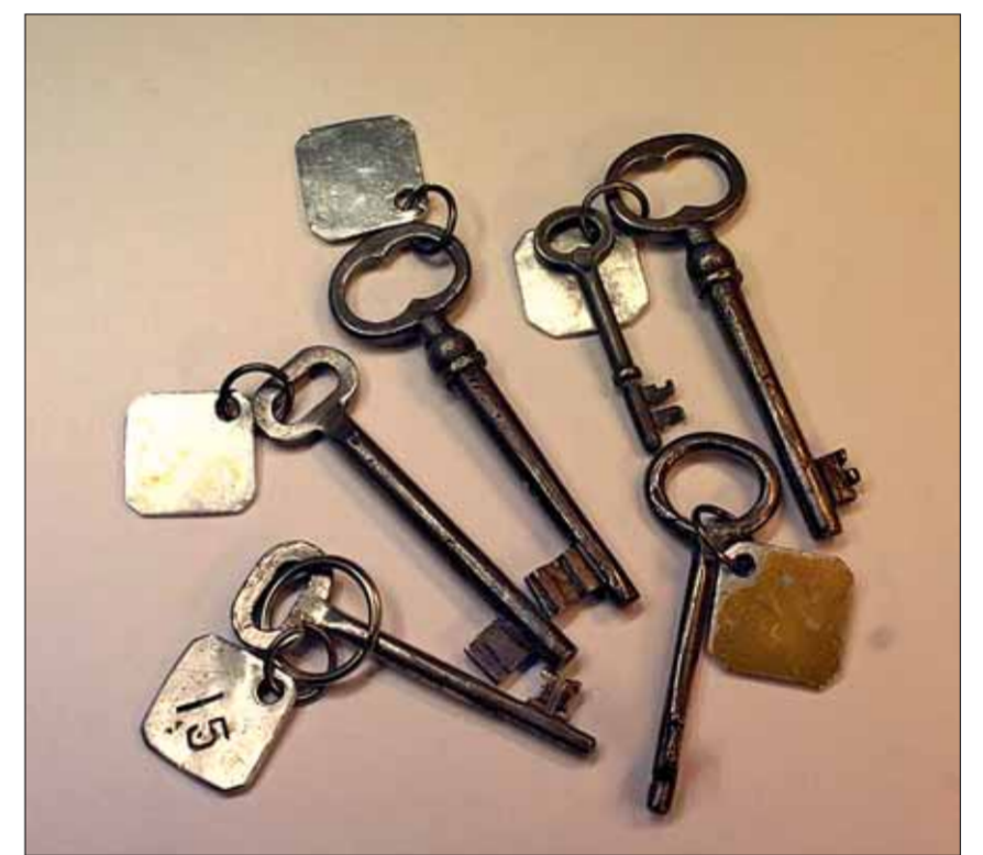
Ключи ульберговских времен используются сегодня