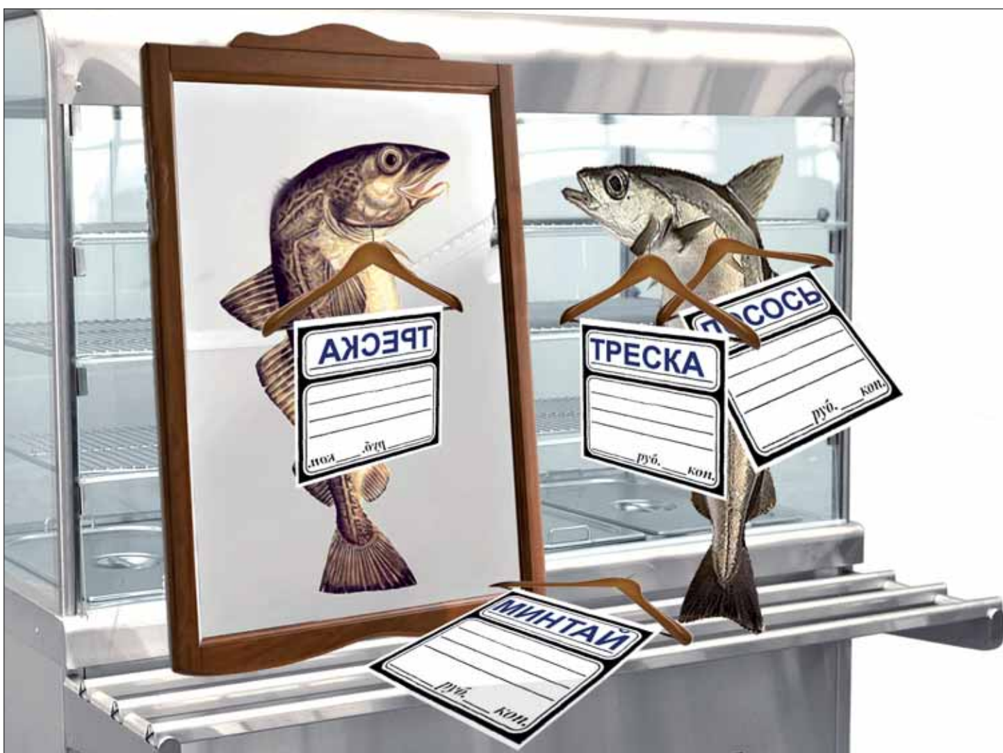
Коллаж Ирины МАКСИМЕНКО

Вслед за «мясным» скандалом, произошедшим потому, что ряд производителей выдавал конину за говядину, последовал «рыбный». Причина одна: выдавая более дешевой товар за дорогой, производители пытаются минимизировать потери и снижение спроса.