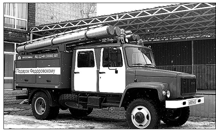
До этого в случае возгораний в поселение приезжали пожарные из Тосно, до которого более 30 километров. Светлана БУРЕНИНА

8 апреля Федоровское сельское поселение Тосненского района получило новую пожарную машину.