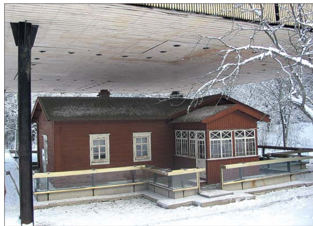
Дом Парвиайненов, где в августе 1917 года скрывался В.И. Ленин